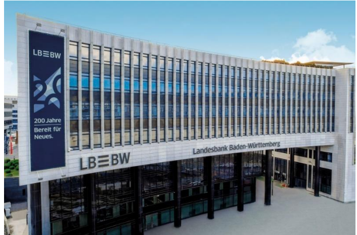
LBBW Standort Stuttgart

Weitere Referenzen finden Sie unter: www.grobmanschwarz.de/kundenreferenzen